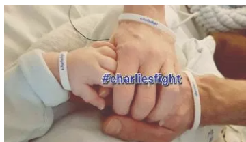
Salvate il soldato Charlie 02/07/2017 In "Generale"